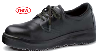
ARD210 静電 重量:940g/足