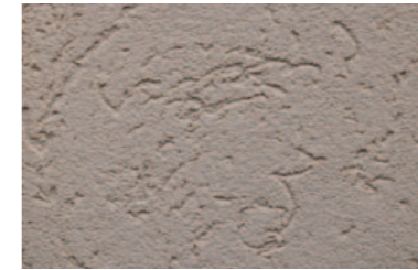
ランダム 適量に配合された中荒目の骨材を大きく転がし、不規則な模様を表現します。