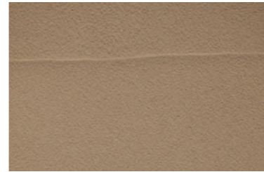
ノーマル 細目の骨材を配合し、コテの種類や動かし方によって、自由な模様を表現できます。