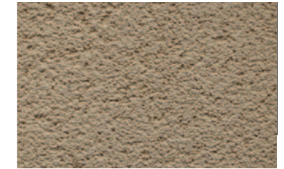
グリッド 荒目の骨材をコテで押さえることで、均一に配置させた模様です。