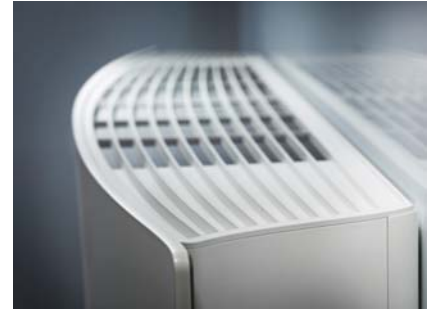
【左右両端の薄さと壁に向かって流れるウェーブデザインで一体感を演出】