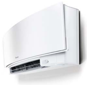
【人感センサーを標準搭載】

風が直接当たりにくくするために上下の吹き出しを制御する従来の「風ないス」運転に加え、人感センサーを搭載して左右への吹き出しを自動で制御することで、人の居ないエリアに風向を調節し、風が当たることによる肌寒さを軽減します。