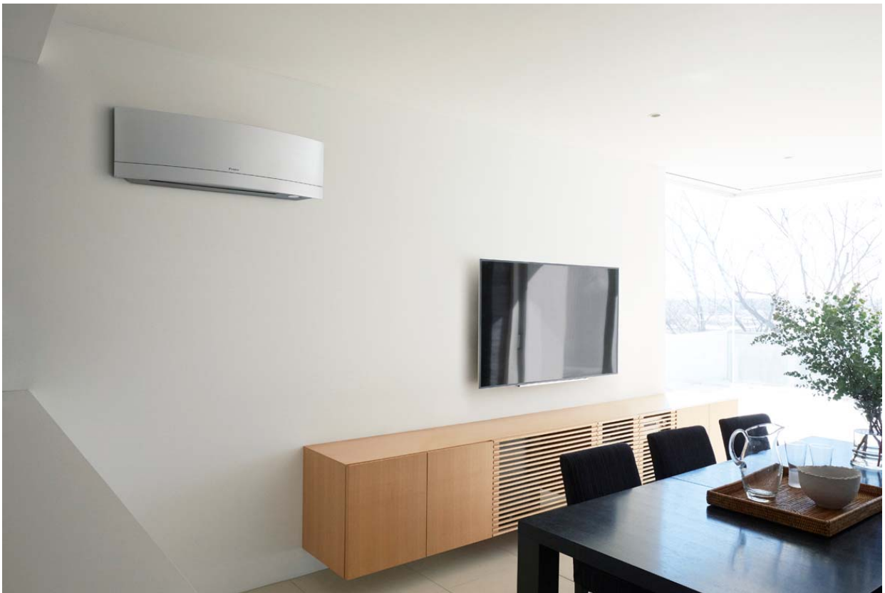
設置事例【壁に溶け込む一体感とインテリアとの調和をデザイン】

風の「心地よさ」をイメージしました。さざ波や、ユラユラとはためく旗など、風は様々な場所で感じることができ、やわらかなウェーブで心地よさを与えてくれます。このやわらかな風のイメージを室内機に表現し、空気調和の心地よさに加えて視覚での心地よさも演出します。