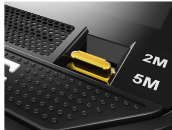
【本体前面下部のウォータースイッチ】