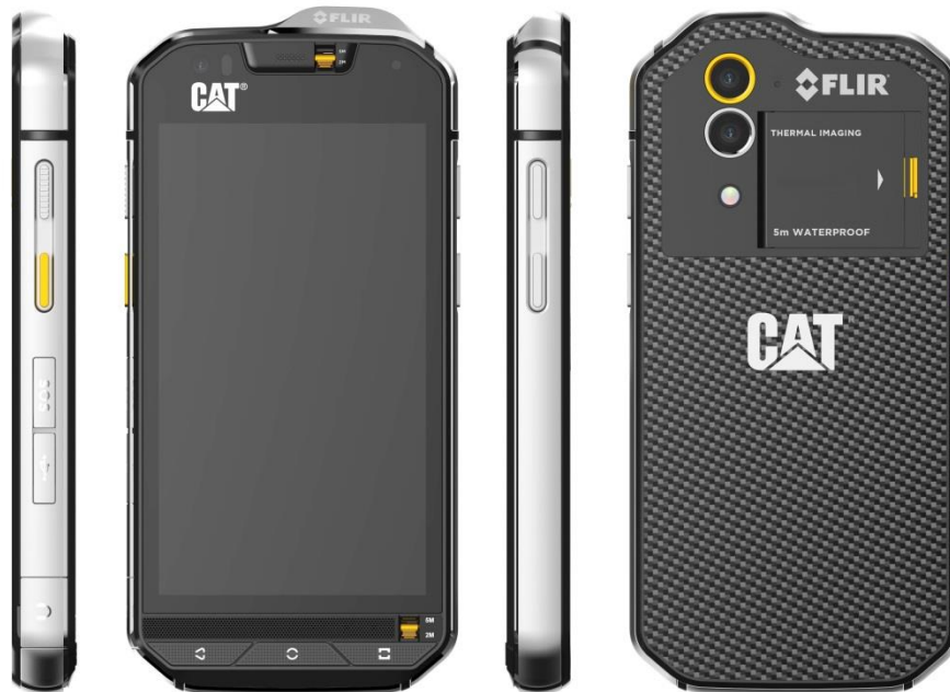
(右側面) (本体前面) (左側面) (背面)

世界初 ※1 、サーマルイメージングカメラを搭載した CAT®ブランドの最上位スマートフォン 厳しい環境下での使用にも耐えられる SIM フリースマートフォン「S60」の販売を開始 ～耐衝撃性能規格”MIL-STD-810G ※2 ”や防水・防塵規格”IP68 ※3 ”に対応～