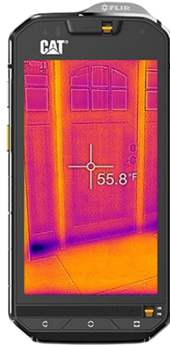
【サーマルイメージングカメラを使用しているイメージ(画像はイメージです)】