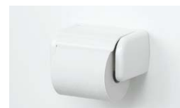
ワンタッチ式紙巻器