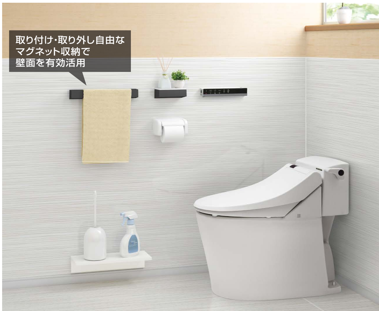
※どこでもラック使用イメージ