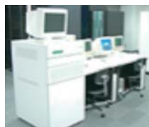
自動監視システム