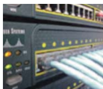
ネットワーク管理