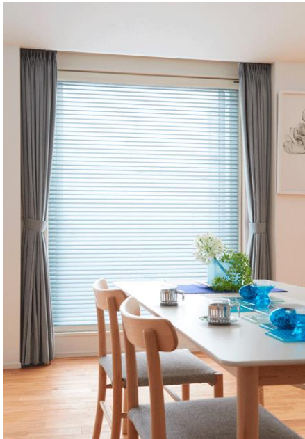
広幅タイプ施行例 (スカイブルー)