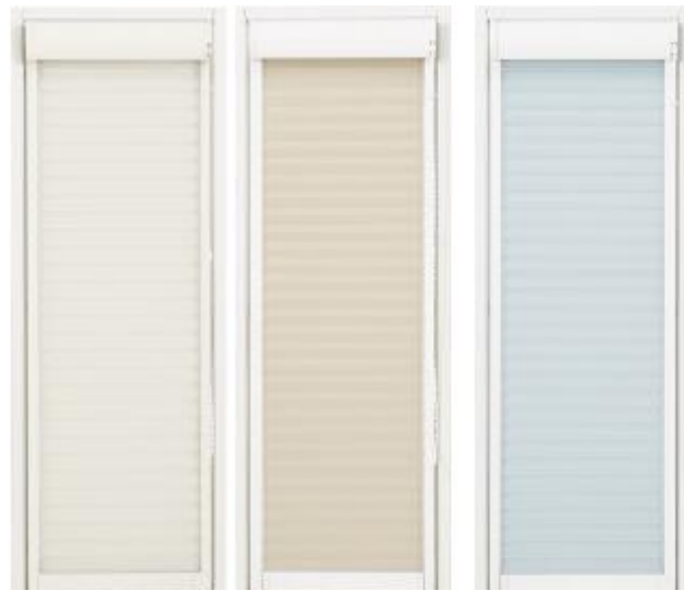
カラーバリエーション