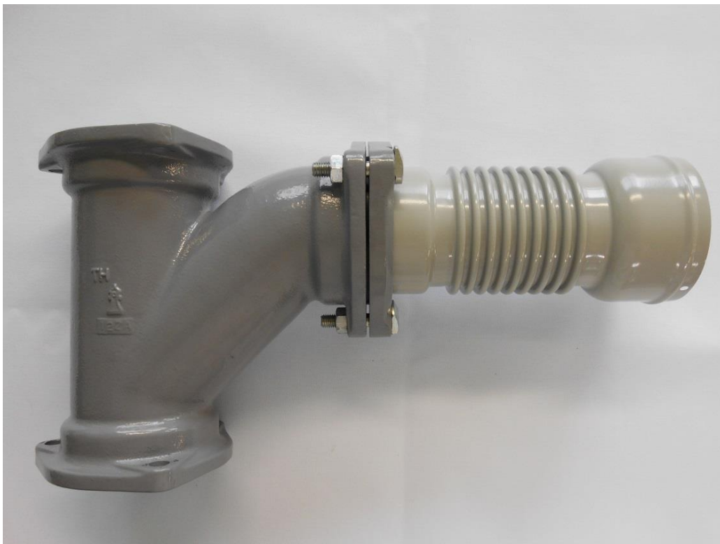
【写真:MD継手ボルト締めタイプと接続している写真】

今回の「強化タイプ」は、フランジのボルト締め付け時に片締めが行われても変形を起こしにくい強度を保有し、パーツの失損率を低下させ施工性をアップさせます。