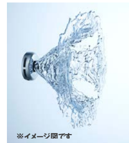
水流の広がりイメージ図

エアを含まない広がりある水流が、お湯を攪拌しながら身体を包み込み、身体の芯から温めてくれます。またマンションなどの階下等への振動や騒音にも配慮した設計によって、浴室内も静穏に保つことが可能になり、テレビやデジタルサウンドをこころゆくまで楽しむことができます。