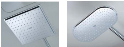
左：スクエア、右：ヴェリス