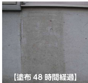
【塗布 48 時間経過】