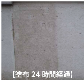
【塗布 24 時間経過】