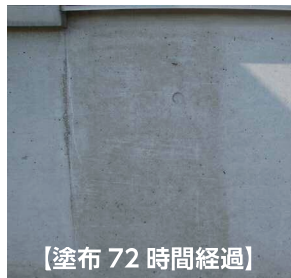
【塗布 72 時間経過】

【注】上記退色確認画像は、南面での退色確認を実施しております。日陰部分、日照時間の条件により退色時間に差が生じる場合があります。