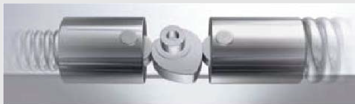
DORMAスライドチャンネル式 ハートカム式ドアクローザ