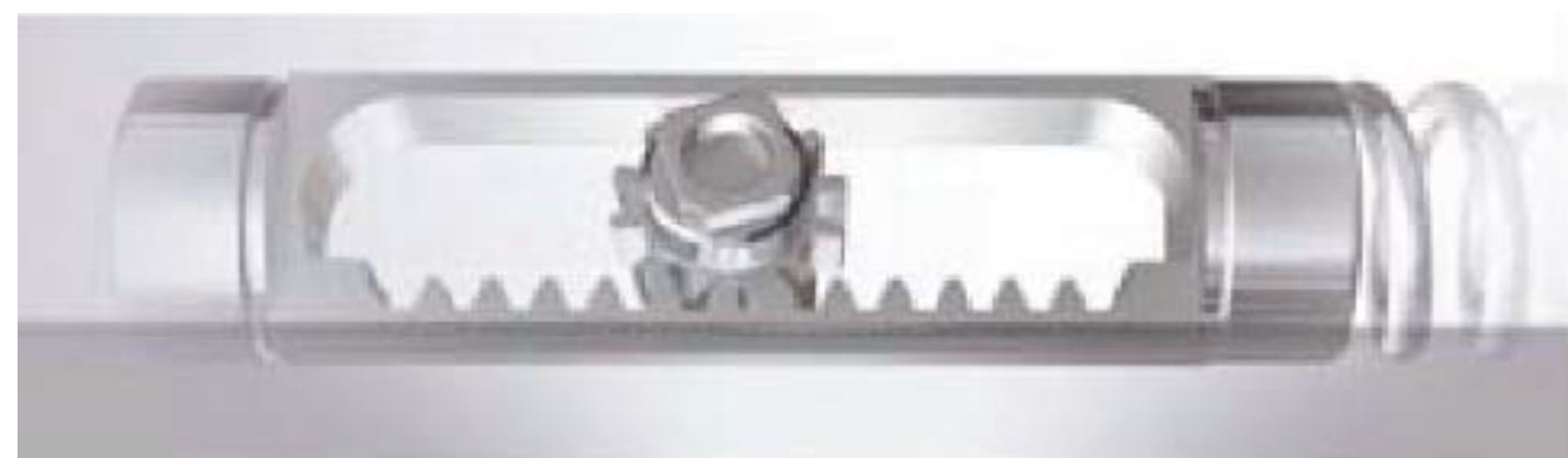
ラック&ピニオン式ドアクローザ

さらに、閉じる間際のトルクが高くなるカム形状を採用しており、電気錠付きのドアや高気密ドアに最適です。