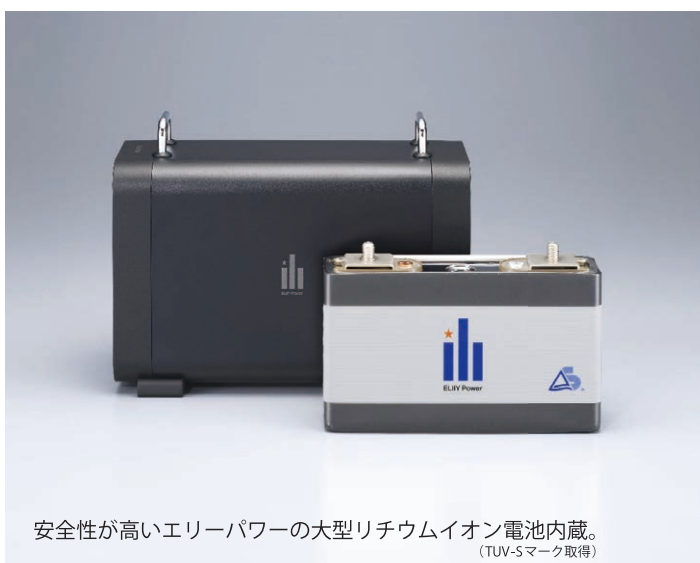
安全性が高いエリーパワーの大型リチウムイオン電池内蔵。 (TUV-Sマーク取得)