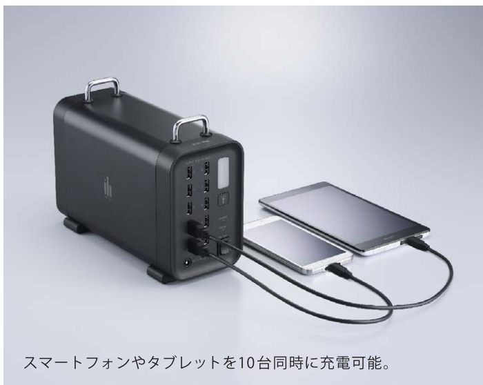
スマートフォンやタブレットを10台同時に充電可能。

停電や災害時、もしもの時に、これ一台で電源確保。しかもエリーパワーだから安心の品質。