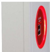
横からでも見やすい工夫

② 発信機の周りに表示灯をリング状にレイアウトすることで、夜間における押しボタンの見やすさが向上しました。